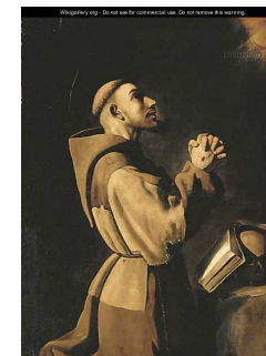
Modlící se sv. František z Assisi Francisco de Zurbarán

Modlitba je tím vším a ještě něčím mnohem větším.