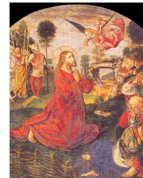
Ježíš modlí se v Getsemanské zahradě Pedro Berruguete

Ježíš se podle svého lidského srdce naučil modlit od své matky a z hebrejské tradice. Avšak jeho modlitba vyvěrá z jiného, skrytějšího pramene, neboť je věčný Syn Otce, který se ve svém svatém lidství obrací k svému Otci dokonalou synovskou modlitbou.