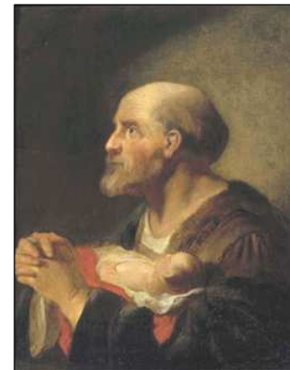
Sv. Josef s dítětem Ježíš při modlitbě Pieter de Grebber

Gertruda z Helfty: „Modlitba má velkou sílu, jestliže se člověk modlí podle svých nejlepších schopností. Do zahořklého srdce vlévá sladkost, do smutného radost, do ubohého bohatství, do pošetilého moudrost, do ustrašeného odvahu, do slabého sílu, slepému vrací zrak a chladnému žár. Přitahuje velikého Boha do maličkého srdce; pozvedá lačnické duši k Bohu, živému prameni, a přivádí k sobě dva milující: Boha a duši.“