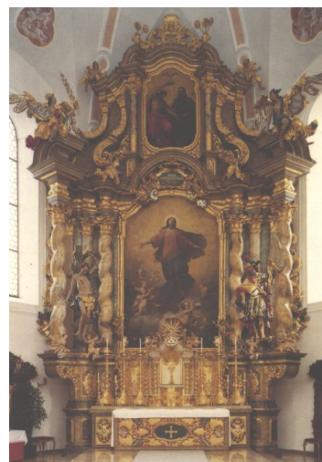
Hlavní oltář kostela Nanebevzetí Panny Marie v německém pohraničním městě Furth im Wald.